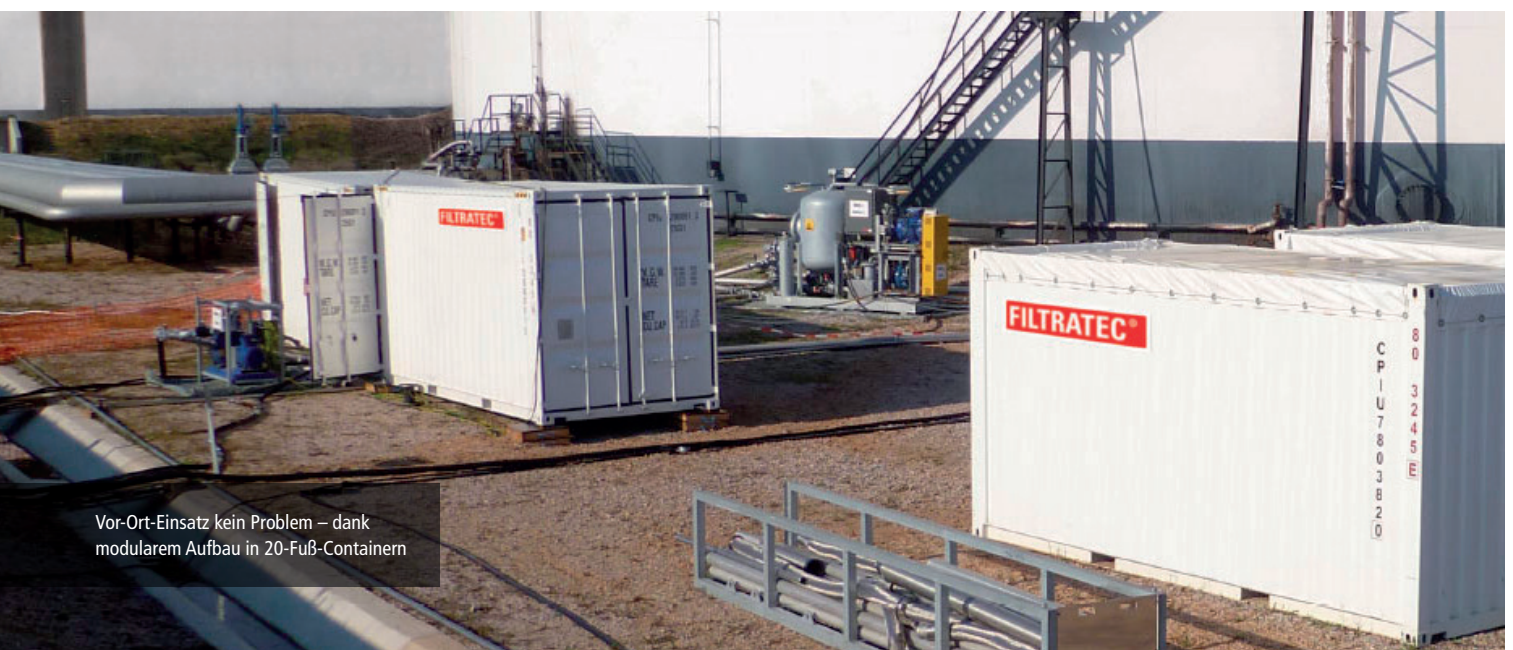
Vor-Ort-Einsatz kein Problem – dank modulare Aufbau in 20-Fuß-Containern