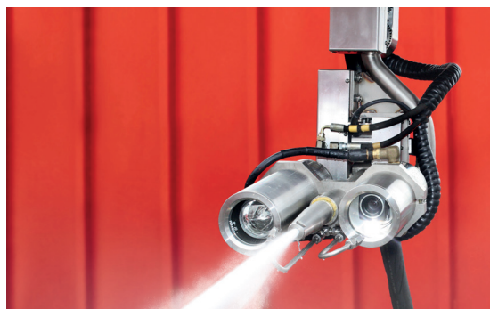
Die Kamera der Manway-Cannon zeichnet den Reinigungsvorgang auf und dient damit auch der Dokumentation

Abhängig vom Restinhalt des Tanks heizen wir die Spülmedien über Wärmetauscher auf, um das Löseverhalten zu verbessern. Die ausgetankten Suspensionen aus Tankbodenschlamm und Spülmedium trennen wir anschließend mittels unseres 3-Phasen-Dekanters – komplett im geschlossenen System unter Stickstoffatmosphäre – in Feststoffe, Öl und Wasser, so dass ausschließlich der minimierte Feststoffanteil entsorgt werden muss.